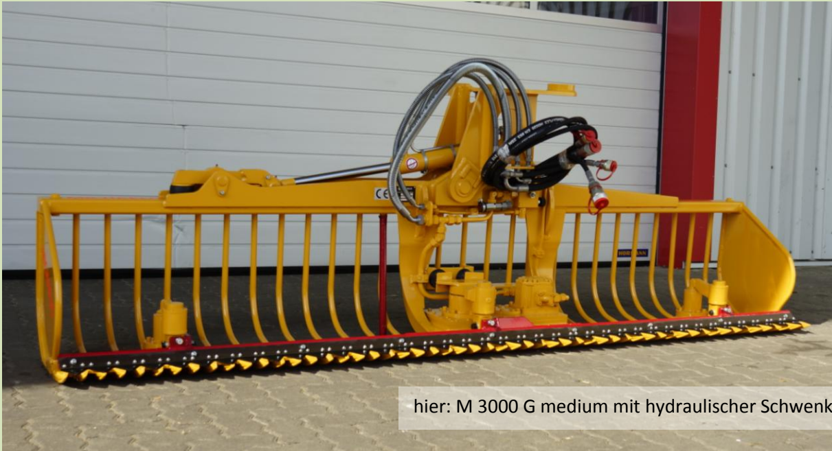
hier: M 3000 G medium mit hydraulischer Schwenkeinrichtung